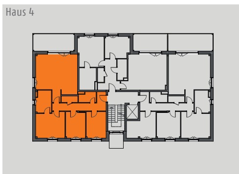
Lage im Objekt