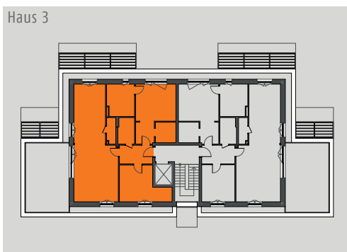
Lage im Objekt